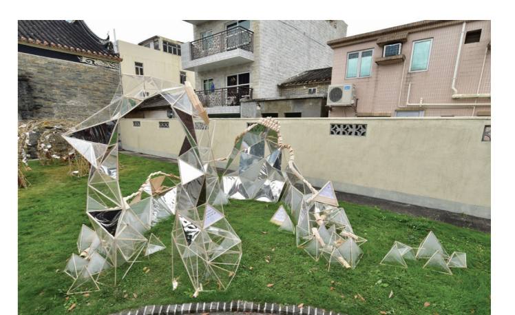
香港高等教育科技學院園境建築(榮譽)文學士的作品「凝」。