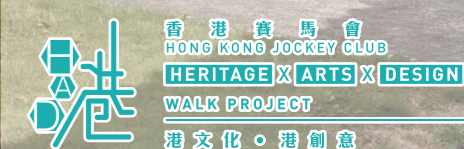
HERITAGE X ARTS X DESIGN WALK PROJECT 溯文化·創新意