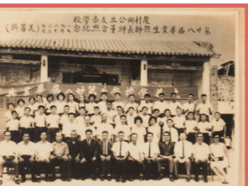
1963年舊校舍最後一屆畢業。