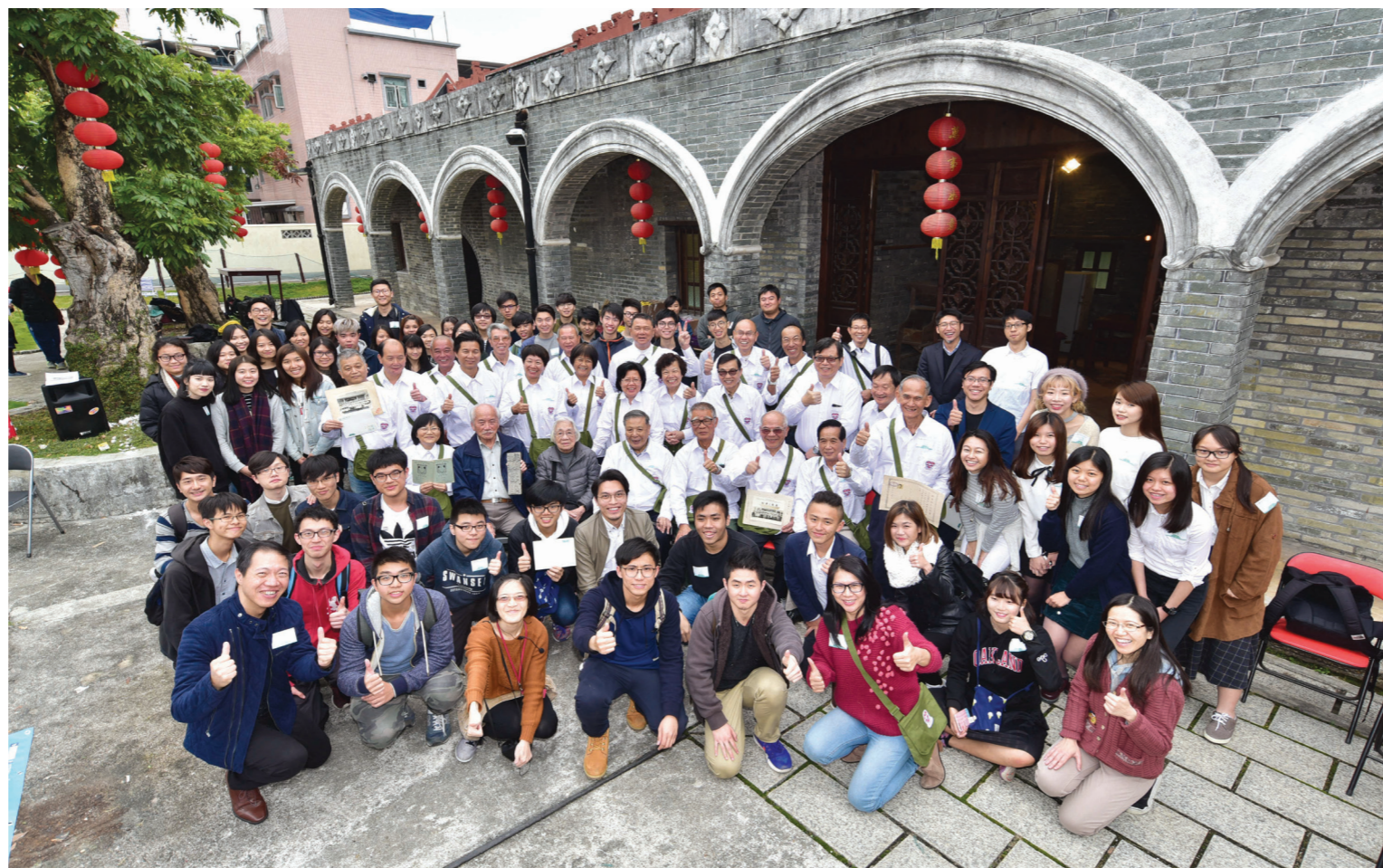
難得不同屆的友恭舊生和老師校長聚首一堂，加上來自大專院校的師生來一張大合照，一同見證友恭學校的有情歲月。