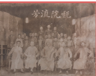
祠堂壁上這幀，似是百年前師生合照。

建於清乾隆己巳年(1749)的鄧氏宗祠(又名友恭堂)，連同祠堂後方接近一百年的友恭學校舊址，對廈村鄉民來說，不單是歷史古蹟、祖嘗文物，也是一代接一代承傳文化的教育場所，滿載幾許白髮老翁的童稚回憶。