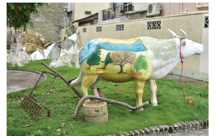
早年新界生活以務農為主，今天草地上重置牛的裝置加上昔日農具，令人回味無窮。