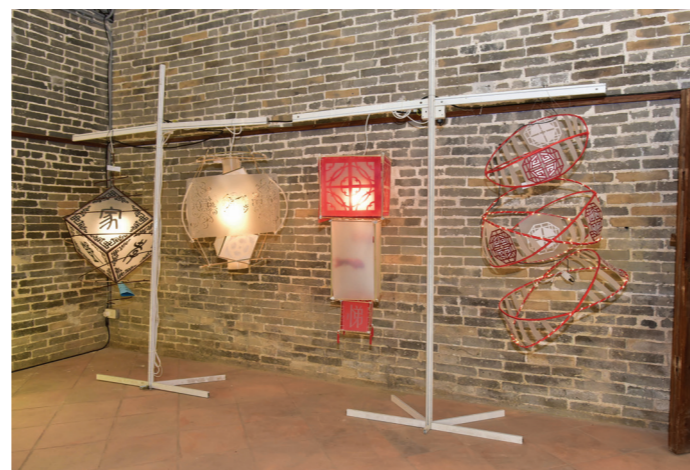
香港高等教育科技學院產品設計(榮譽)文學士學生以圍村作主題的燈具，揉合傳統和現代的風貌。