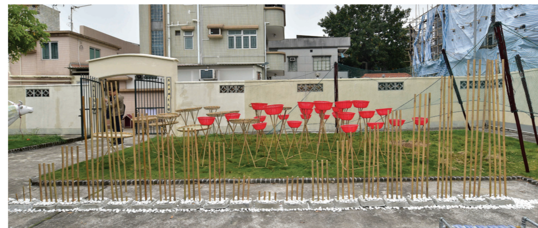
香港知專設計學院園境建築高級文憑學生作品「厦村市集」及「中軸線」。