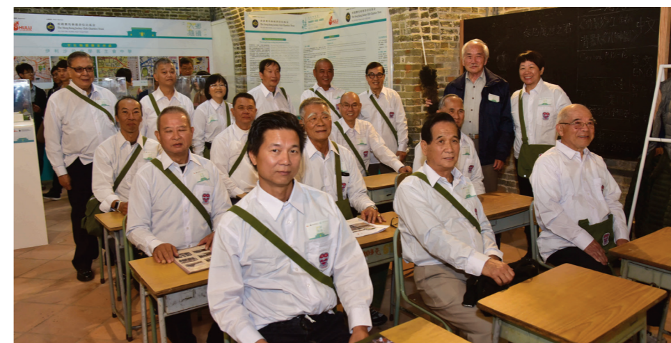
一班舊生穿上校服，坐在友恭學校中，緬懷那些年的童真歲月。