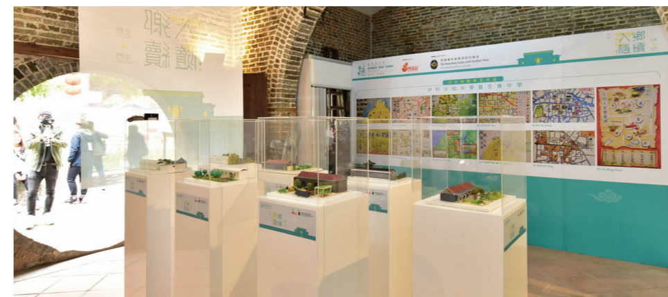
香港高等教育科技學院園藝及園境管理設計(榮譽)文學士為友恭學校庭院設計想像藍圖模型。