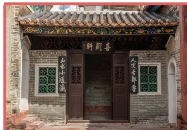
喜聞軒曾用作教員室。