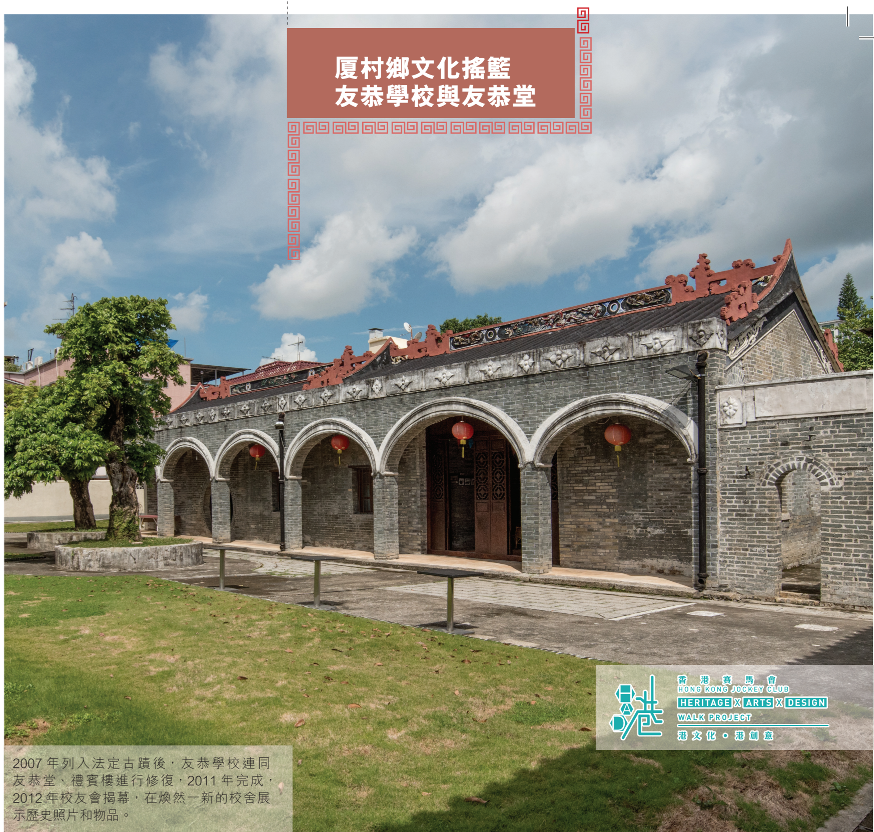
2007年列入法定古蹟後，友恭學校連同友恭堂、禮賓樓進行修復，2011年完成，2012年校友會揭幕，在煥然一新的校舍展示歷史照片和物品。