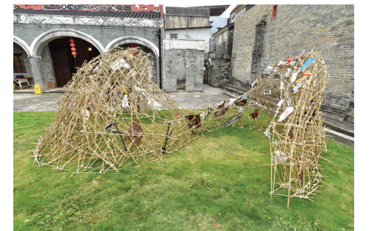
香港高等教育科技學院園境建築(榮譽)文學士的作品「漩渦」。