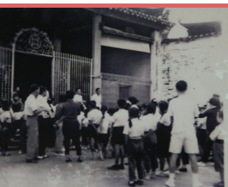
當年學生經祠堂進入學校。